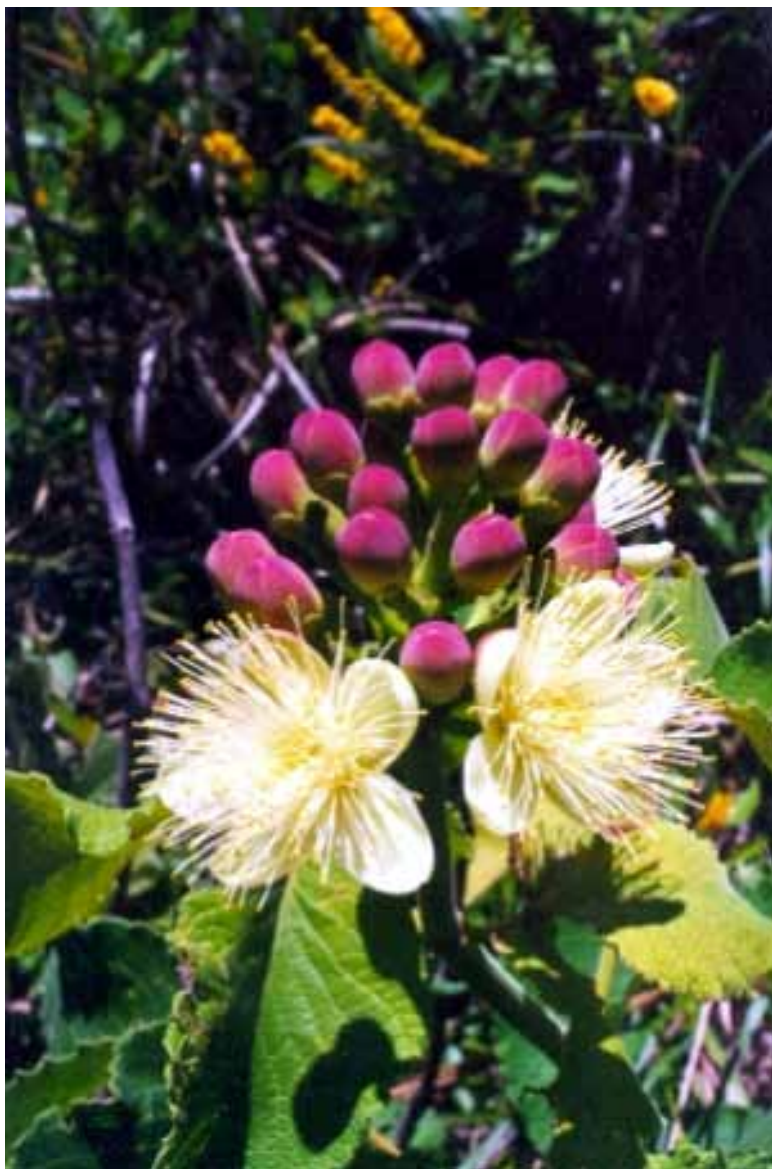
Pequi ( Caryocar brasiliense )