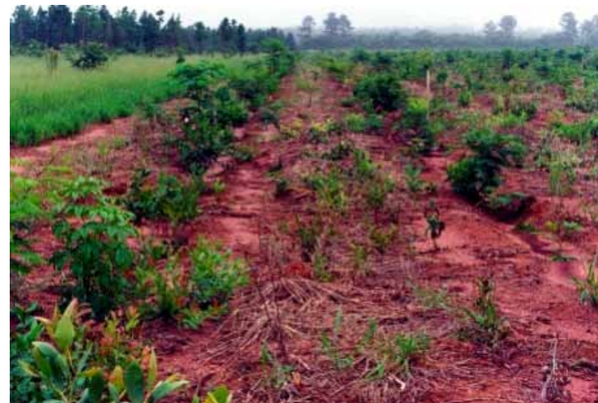
Figura 5. Plantio convencional para restauração do cerrado na Floresta Estadual de Assis, SP, com uso de herbicida nas entrelinhas, preservando as plantas lenhosas em regeneração natural.

Coveamento – covas maiores resultam em melhor crescimento inicial das mudas plantadas; porém, quanto maior a cova, maior o custo de plantio. Recomenda-se cova de pelo menos 30 cm de diâmetro e 40 cm de