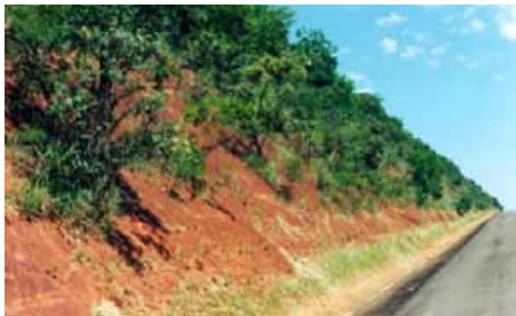
Figura 3. Regeneração da vegetação de cerrado em área de corte (Rodovia Castelo Branco SP)