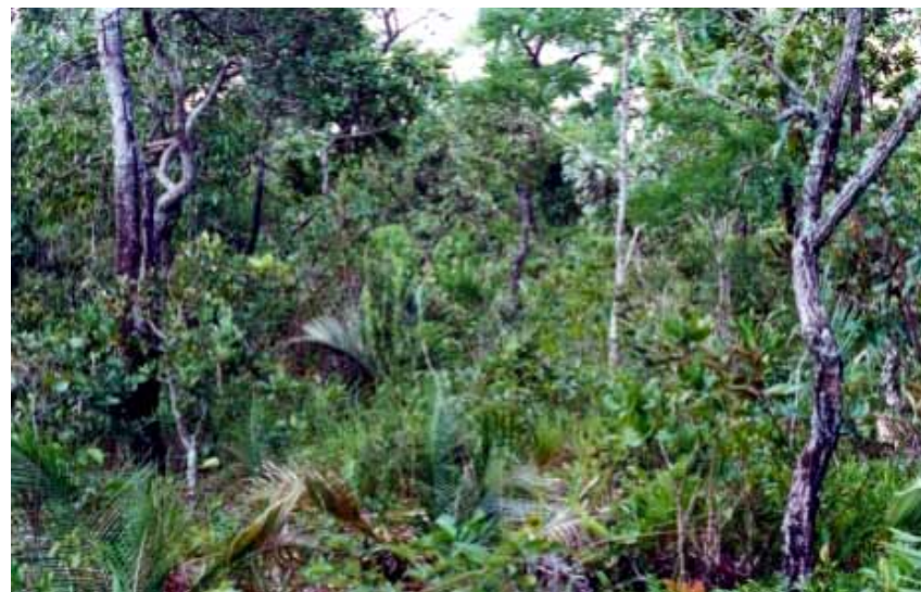
Figura 2. Vegetação de cerrado em Itirapina, SP.

Em linhas gerais, podem ser recomendadas três técnicas para a recuperação da cobertura vegetal do cerrado, descritas a seguir: