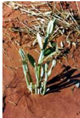
Figura 4. Rebrotas vigorosas de plantas do cerrado a partir de estruturas subterrâneas

Para as áreas cultivadas com florestas de produção, especialmente após desmatamento, geralmente basta eliminar as árvores plantadas para que ocorra a regeneração natural do cerrado, pois as espécies nativas permanecem no subosque.