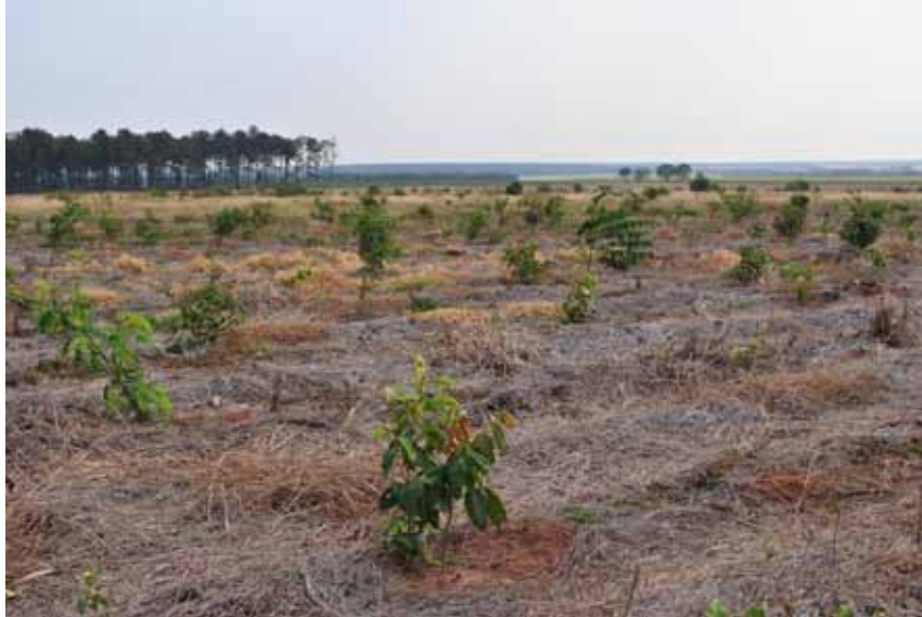
Figura 6. Plantio controlado apenas com aplicação de herbicida (Floresta Estadual de Assis)

O produto não deve ser aplicado sobre capim seco ou folhas velhas. Nesses casos, deve-se roçar o capim, aguardar a rebrota (cerca de 20 dias) e pulverizar o produto sobre as folhas novas, na dosagem de 2,5 kg de glifosato por hectare.