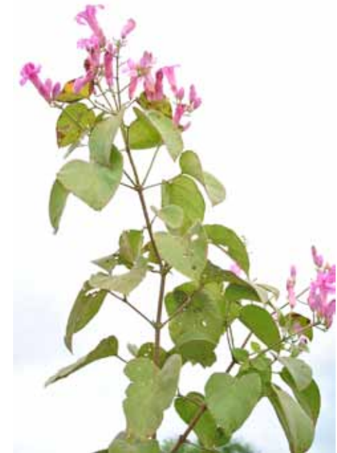
Figura 7. Arrabidaea sceptrum (Arboreto do cerrado na Floresta Estadual de Assis)

No Quadro 1 é apresentada uma análise comparativa das situações possíveis e técnicas de recuperação recomendadas para cada tipo de vegetação.