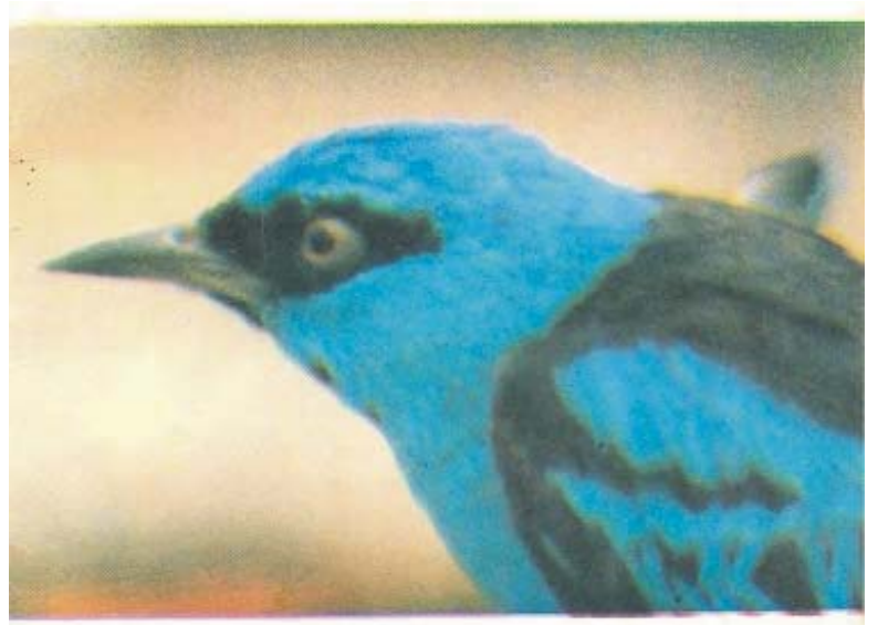
Verdelinho Dacnis cayana