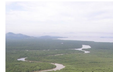
Acervo Esec Guanabara